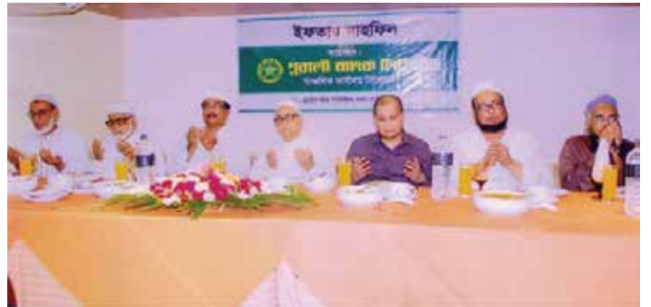
পূবালী ব্যাংক লিমিটেড সিলেট আঞ্চলিক কার্যালয়ের উদ্যোগে সিলেট নগরীর একটি অভিজাত রেস্টুরেন্টে ইফতার মাহফিল অনুষ্ঠিত হয়